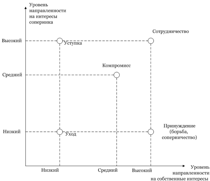
Рис. 1. Стратегии поведения в конфликте

Однако, хорошая медиация может быть нацелена и на компромисс: любой вид взаимной договоренности, позволяющий реализовать интересы участников в наличной ситуации, при наличных внутренних и внешних ресурсах (условиях). Движение же к сотрудничеству возникает, если стороны, участники или носители внутреннего и внешнего конфликта заинтересованы в сохранении нормальных партнерских отношений в перспективе, в собственном развитии, а также имеют будущие общие или индивидуальные интересы, более значимые, чем интересы прошлого и настоящего и связанные с ними претензии и обвинения, желания мести и расправы, отчуждения и разрывы и т.д. [Вацке 2009].